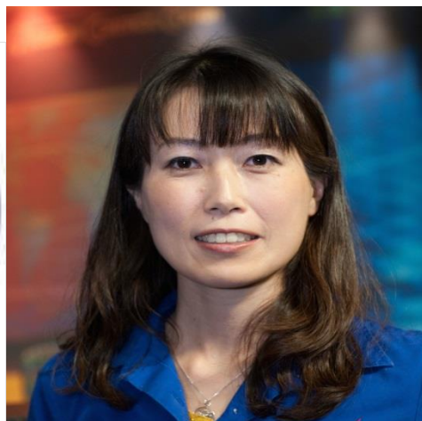
日本人女性宇宙飛行士第2号 スペースシャトル最後の搭乗者