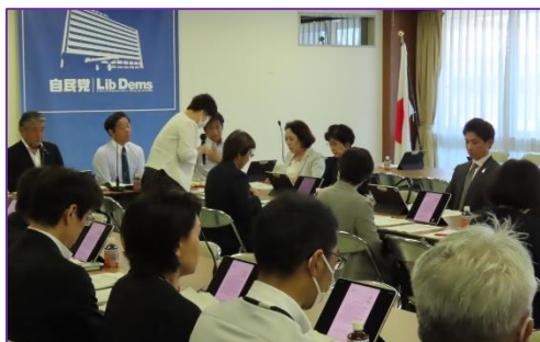
自民党看護問題小委員会開催時の様子

精神科医療機関には、このような事業に求められる専門知識や技術を有した人材が多く所属しており、精神科医療機関自体も各地に点在しているため行政機関とも連携が図りやすく、地域の精神保健福祉業務に関する役割を担うことができれば、より一層の強化が見込めます。また、精神科医療機関に従事する専門職の知識や技術は、精神疾患や精神障害に関する普及啓発の推進にも寄与できるため、医療機関の専門職を地域の精神保健福祉に関する事業に活用するための予算措置を強く要望いたします。